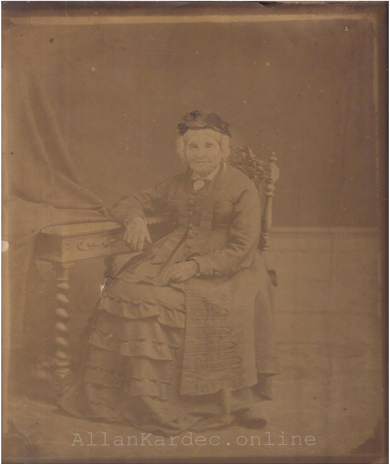
AMÉLIE GABRIELLE BOUDET (1795 - 1883)