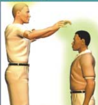
Dr. Bezerra de Menezes