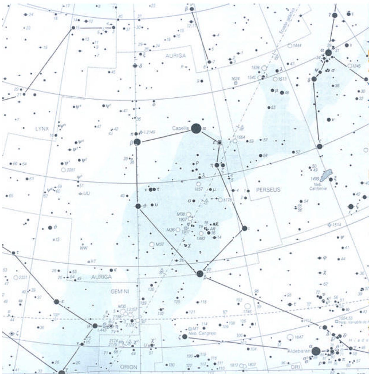
MAPA CELESTE (PARCIAL) CON LA LOCALIZACIÓN DE CAPELA, ESTRELLA (DE MAYOR BRILLO) DE LA CONSTELACIÓN DEL COCHERO