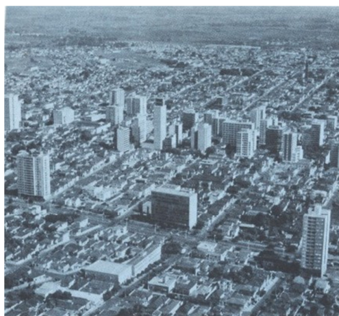
Vista aérea da cidade de São José do Rio Preto