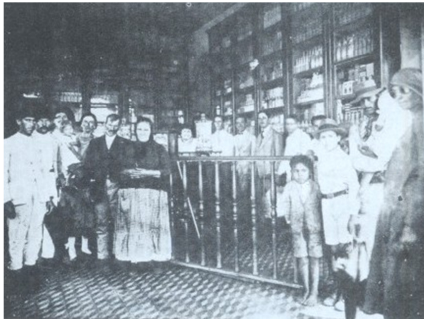
Interior da Pharmacia Nossa Senhora do Carmo