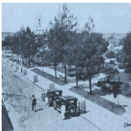
Trecho da Rua Bernardino de Campos, vendo-se parte da Praça Ruy Barbosa.