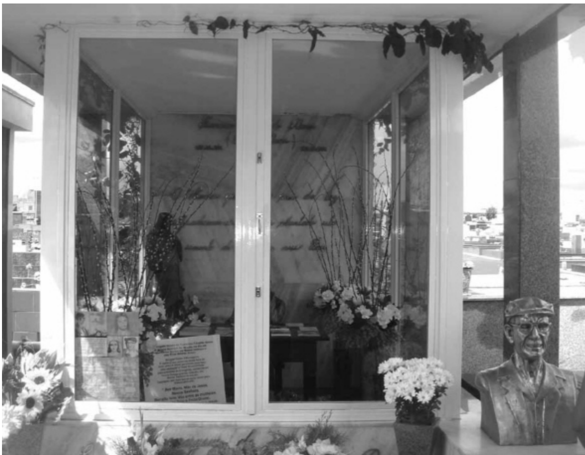
Frente do mausoléu em homenagem a Chico Xavier.