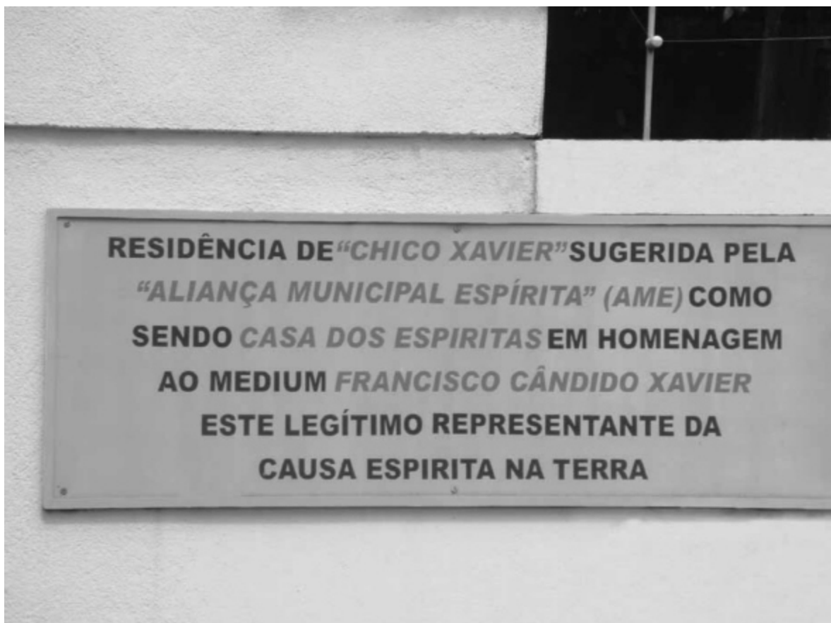
Placa na entrada da residência de Chico, transformada em museu.