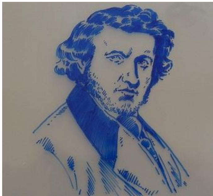
Rivail aos 25 anos (Mozart Cunha do Couto)