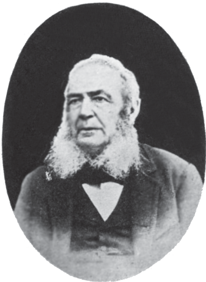
Capitán RAMÓN LAGIER Y POMARES