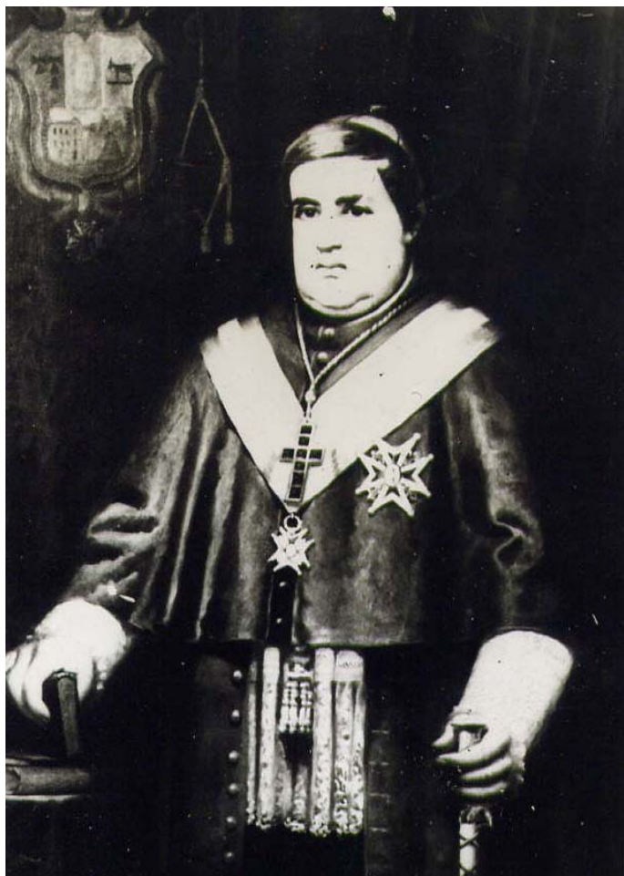
Obispo ANTONIO PALAUS Y TERMENS